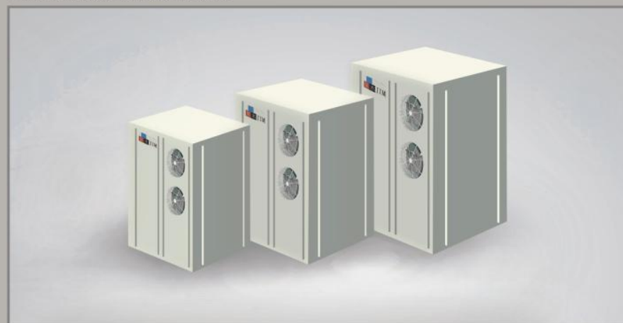
空气源恒温热泵热水机组技术参数表